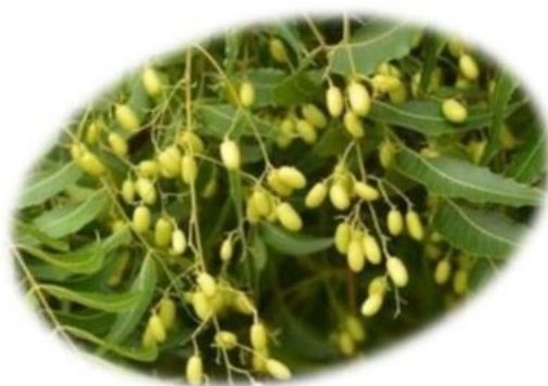
Extraído de uma planta ( Azadirachta indica )